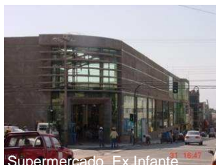
Supermercado Ex. Infante