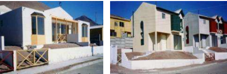
Conjunto Imilac- Salares- Flamencos- Escondida