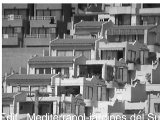
Edif. Mediterraneo-jardines del Sur