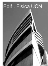
Edif. Fisica UCN