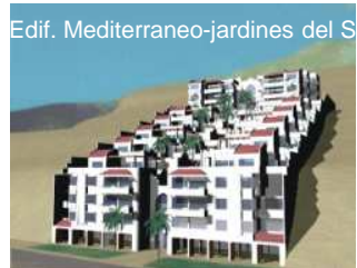
Edif. Mediterraneo-jardines del Sur