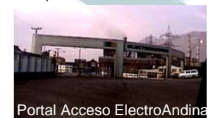
Portal Acceso ElectroAndina