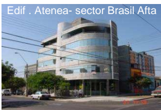
Edif. Atenea- sector Brasil Afta