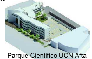
Parque Científico UCN Afta