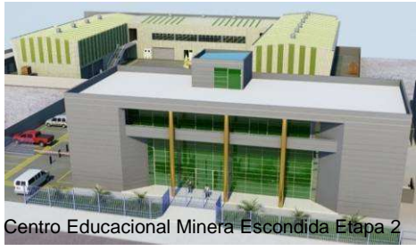
Centro Educacional Minera Escondida Etapa 2