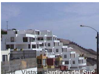
Edif. Vistazul-jardines del Sur