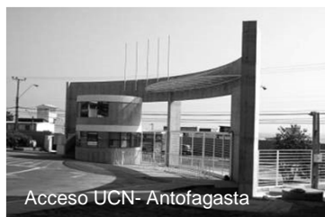
Acceso UCN- Antofagasta