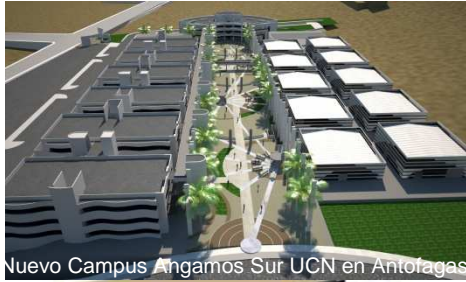
Nuevo Campus Angamos Sur UCN en Antofagasta