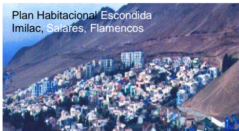
Conjunto Imilac- Plan Habitacional Escondida