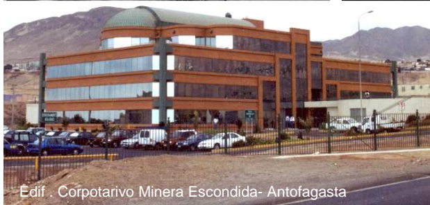
Edif. Corporativo Minera Escondida- Antofagasta