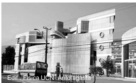
Edif. Fisica UCN- Antofagasta