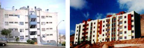
Plan Habitacional Escondida Imilac, Salares, Flamencos