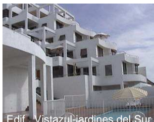
Edif. Vistazul-jardines del Sur