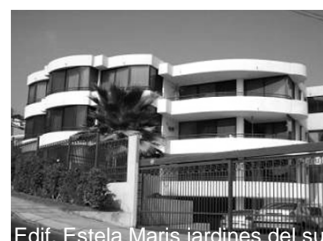
Edif. Estela Maris jardines del Sur