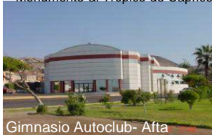
Gimnasio Autoclub- Afta

Monumento al Trópico de Capricornio sector aeropuerto en la ciudad de Antofagasta