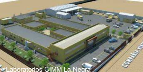
Laboratorios CIMM La Negra