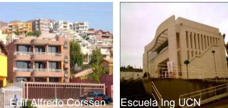
Edif. Alfredo Corssen