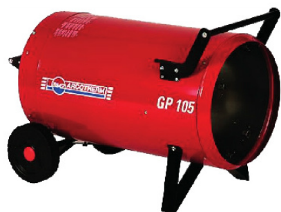
AHN PRO GP 105 93,600 K/CAL 3,700 M3/H