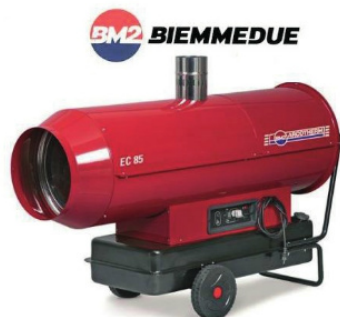
EC85 4300 METROS CÚBICOS 220V.