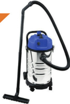
AHN PRO Vacunn Cleare 30l