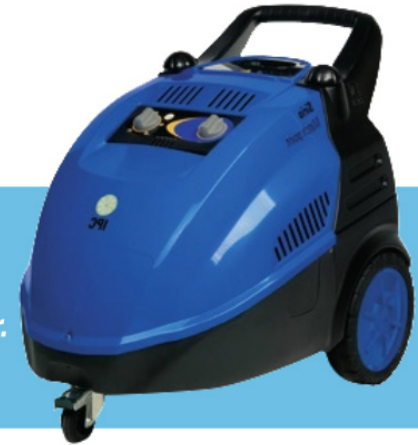
MATCH POINT desde 130 a 160 bar. de 10 a 13 l/m