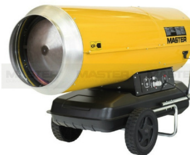
AHN PROB 230 DIRECTO 3000 METROS CÚBICOS