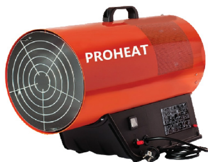
AHN PROHEAT BLP 53-73 A desde 45,600 a 62,380 k/cal 1450 a 2300 m3/h