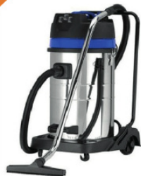
AHN PRO Vacunn Cleare 80l