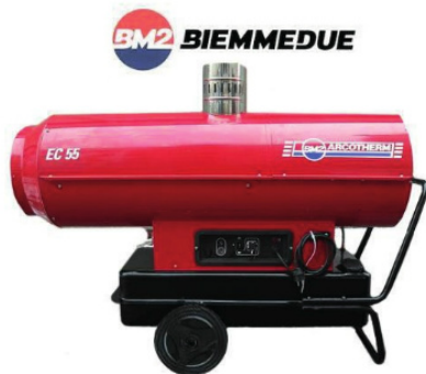
EC55 1400 METROS CÚBICOS