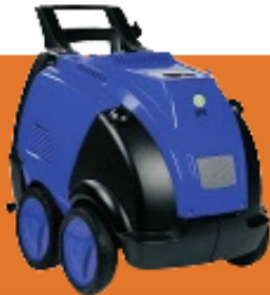
OPTIMA 200 bar. 17l/m 380 volt.