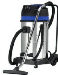
AHN PRO Vacunn Cleare 70l