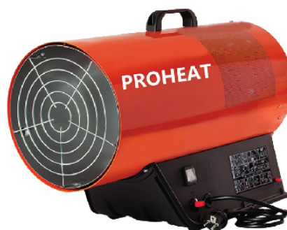
AHN PROHEAT BLP 17-33 m desde 13 760 a 28,500 K/CAL 300 a 1000 m3/h