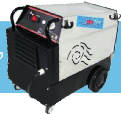
PRO CANCER 130*10 130 bar. 10 l/m