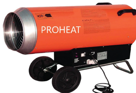
AHN PROHEAT BLP 103 a 88,600 k/cal a 3,260 m3/h