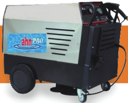
PRO CANCER 200*21 desde 170 a 200 bar. de 13 a 21 l/m