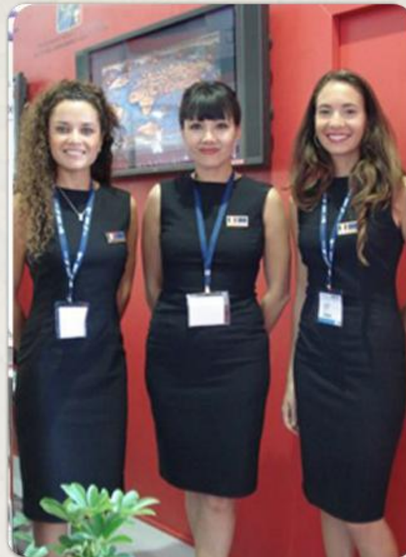
Cliente: Embajada de Italia Anfitrionas para Fidae 2008