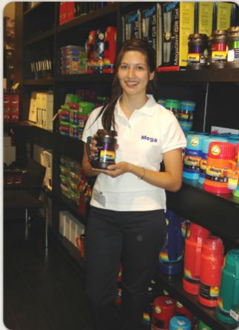
Cliente: Mega Promoción para punto de Venta París