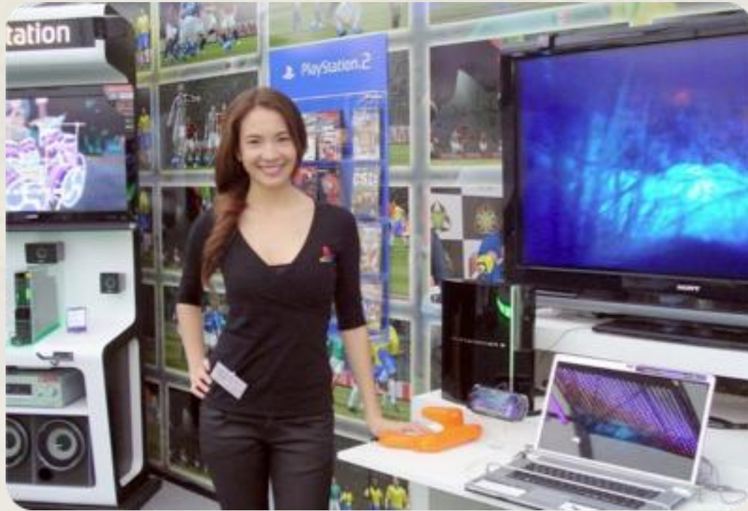
Cliente: Sony Playstation Promotoras para punto de Venta.