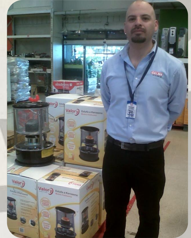
Cliente: Acetogen Promotores calefacción punto de venta Sodimac