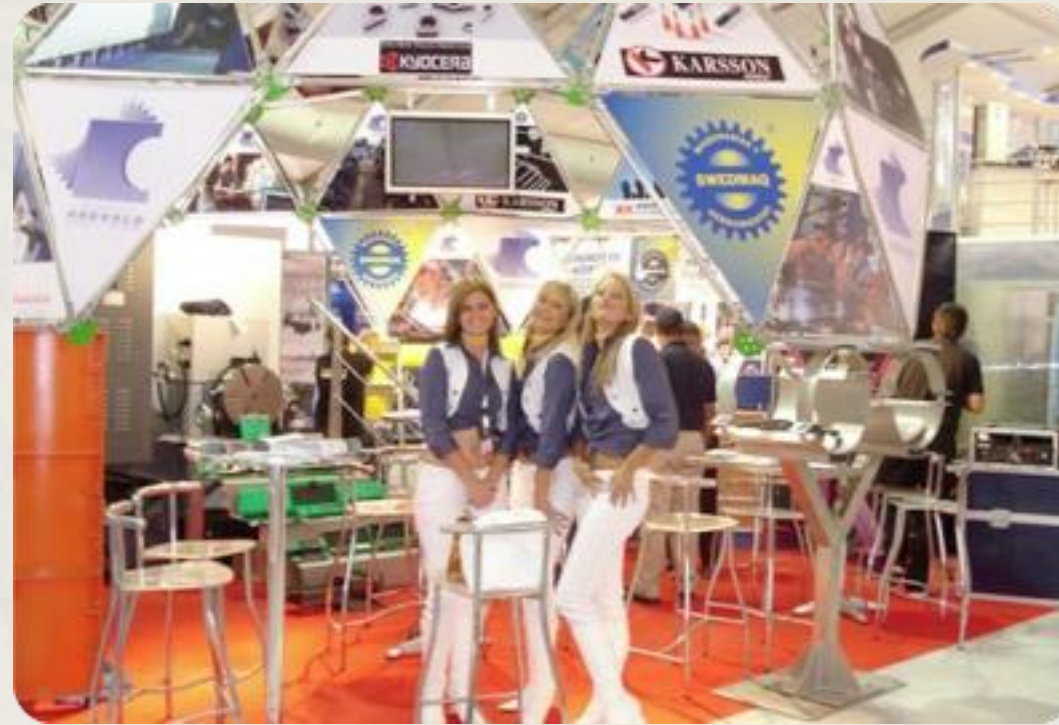
Cliente: Rasa Promotoras y anfitrionas para Expomin.